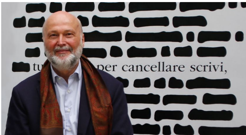
Professore di logica e filosofia della scienza allo IULM

Il nuovo umanesimo planetario, se sarà, sarà prodotto dalla coscienza della comunità di destino che lega ormai tutti gli individui e tutti i popoli del pianeta, nonché l'umanità intera all'ecosistema globale e alla terra.