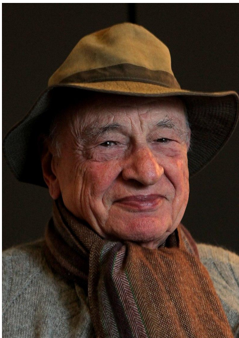
Filosofo e sociologo francese

[...] l'attitudine a contestualizzare e a integrare è una qualità fondamentale della mente umana e ... si tratta di svilupparla piuttosto che di atrofizzarla.